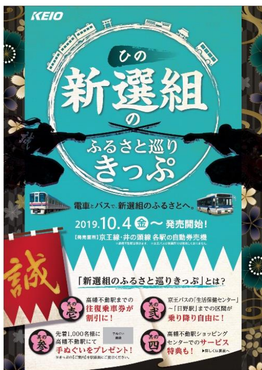
《新選組のふるさと巡り切符PRチラシ》